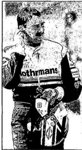
Mansell volta a pé para os boxes

JEREZ DE LA FRONTERA, Espanha — Uma largada abaixo da expectativa, uma bela ultrapassagem sobre Barrichello, participação no melhor momento da corrida, quando o brasileiro deu o troco, e, finalmente, um erro elementar que o tirou da corrida. Nigel Mansell decididamente não teve o retorno que todos esperavam. E não procurou desculpas, admitindo claramente todos seus erros.