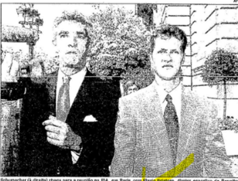
Schumacher (à direita) chega para a reunião na FIA, em Paris, com Flavio Briatore, diretor esportivo da Benetton

— Estou profundamente desapontado. Acho a suspensão injusta — afirmou o piloto, justificando que estava aban-