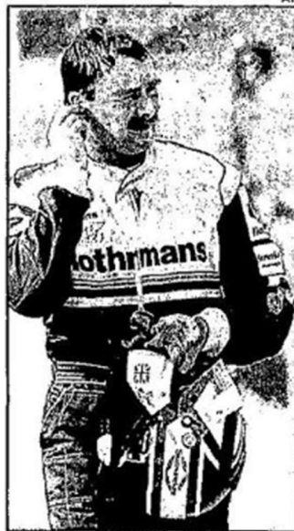
Mansell volta a pé para os boxes

JEREZ DE LA FRONTERA, Espanha — Uma largada abaixo da expectativa, uma bela ultrapassagem sobre Barrichello, participação no melhor momento da corrida, quando o brasileiro deu o troco, e, finalmente, um erro elementar que o tirou da corrida. Nigel Mansell decididamente não teve o retorno que todos esperavam. E não procurou desculpas, admitindo claramente todos seus erros.