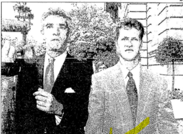
Schumacher (à esquerda) chega para a reunião na FIA, em Paris, com Flavio Briatore, diretor esportivo da Benetton

— Estou profundamente decepcionado. Acho a suspensão injusta — afirmou o piloto, acrescentando que estava abalado.