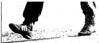
Senna deu novo show de pericia, mas, tralado pela falta de gasolina, acabou a pé

A propósito, foi lembrado que já durante os treinos, Ayrton viu que o "pescador" de gasolina não funcionava quando precisava usar a reserva de combustível. O piloto ontem procurou sacudir o seu carro, já parado, tentando pescar o que poderia ter sobrado ainda de gasolina, mas que só deu para andar alguns poucos metros.