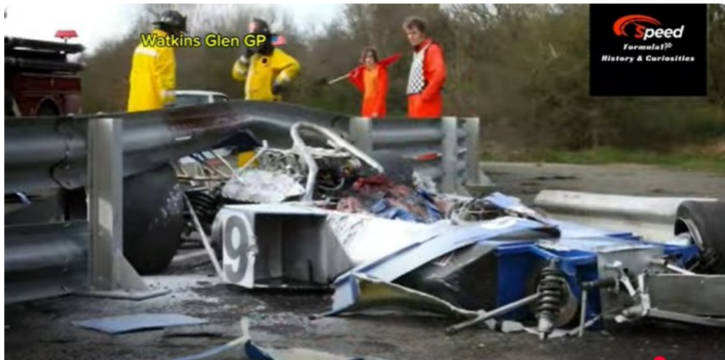
Imagem do acidente de Koinigg nos EUA, reproduzida do Canal Speed Formula1 Channel.

Helmut Koinigg, o piloto austríaco campeão da F3000, morreu decapitado na sua única participação na F1 nos treinos do GP Estados Unidos.