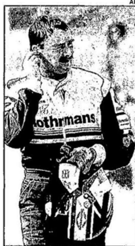
Mansell volta a pé para os boxes

JEREZ DE LA FRONTERA, Espanha — Uma largada abaixo da expectativa, uma bela ultrapassagem sobre Barrichello, participação no melhor momento da corrida, quando o brasileiro deu o troco, e, finalmente, um erro elementar que o tirou da corrida. Nigel Mansell decididamente não teve o retorno que todos esperavam. E não procurou desculpas, admitindo claramente todos seus erros.