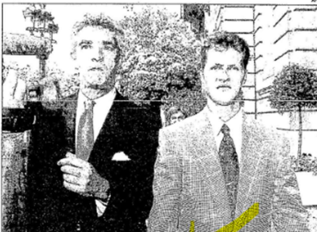
Schumacher (à direita) chega para a reunião na FIA, em Paris, com Flavio Briatore, diretor esportivo da Benetton

— Estou profundamente decepcionado. Acho a suspensão injusta — afirmou o piloto, acrescentando que estava abalado.