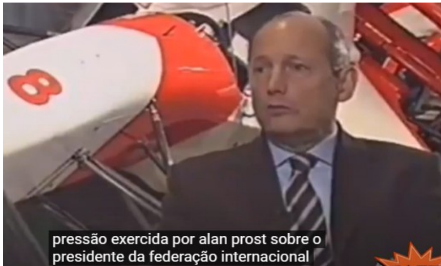
Imagem reproduzida do vídeo da entrevista de Ron Dennis sobre Prost no Japão 1989.

Anos mais tarde, Ron Dennis confirmou em entrevista em vídeo, que Prost pressionou Balestre para manipular o resultado do GP Japão 1989.