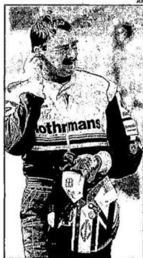
Mansell volta a pé para os boxes

JEREZ DE LA FRONTERA, Espanha — Uma largada abaixo da expectativa, uma bela ultrapassagem sobre Barrichello, participação no melhor momento da corrida, quando o brasileiro deu o troco, e, finalmente, um erro elementar que o tirou da corrida. Nigel Mansell decididamente não teve o retorno que todos esperavam. E não procurou desculpas, admitindo claramente todos seus erros.