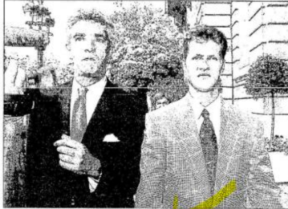
Schumacher (à esquerda) chega para a reunião na FIA, em Paris, com Flavio Briatore, diretor esportivo da Benetton

— Esta é uma punição profundamente injusta. Acho a suspensão injusta — afirmou o piloto, acrescentando que estava abalado.