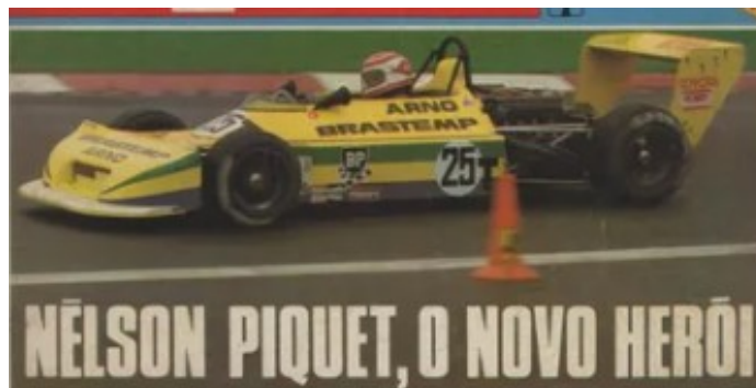
Reproduzido das Revistas Auto Esporte e Quatro Rodas de agosto de 1978.