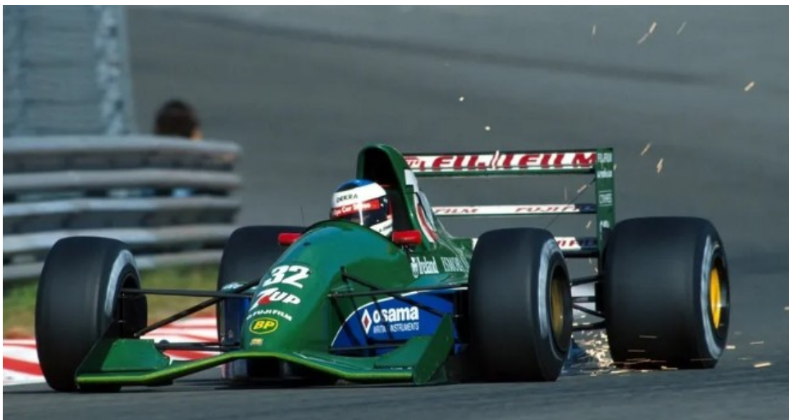
Foto do bico alto da Jordan 1991, com o mesmo conceito do Bico da Tyrrell 1990. O objetivo desse bico era impulsionar o ar para baixo do carro e fazê-lo percorrer o assoalho o mais rápido possível para gerar downforce com o mínimo de arrasto aerodinâmico. Esse conceito foi usado pela Benetton Tubarão.