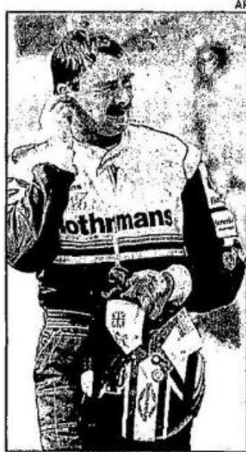
Mansell volta a pé para os boxes

JEREZ DE LA FRONTERA, Espanha — Uma largada abaixo da expectativa, uma bela ultrapassagem sobre Barrichello, participação no melhor momento da corrida, quando o brasileiro deu o troco, e, finalmente, um erro elementar que o tirou da corrida. Nigel Mansell decididamente não teve o retorno que todos esperavam. E não procurou desculpas, admitindo claramente todos seus erros.