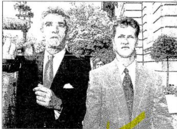
Schumacher (à direita) chega para a reunião na FIA, em Paris, com Flavio Briatore, diretor esportivo da Benetton

— Estou profundamente desapontado. Acho a suspensão injusta — afirmou o piloto, acrescentando que estava satis-