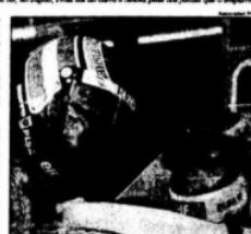
Michael Schumacher em uma corrida.