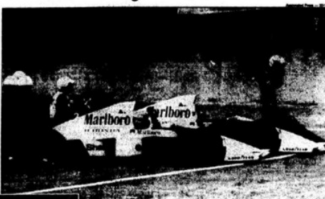
Depois de ajudar Ayrton Senna, em 1993, no Japão, Prost se tornou piloto das Ferrari e o campeão...