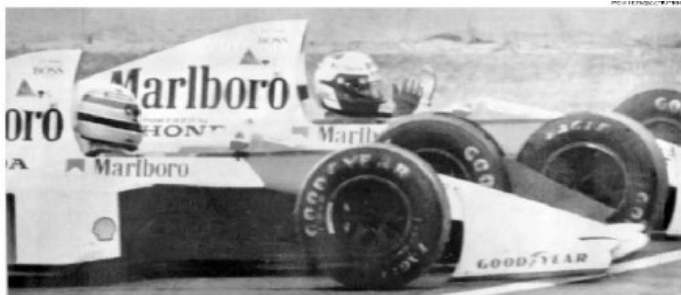
O auge da tensão. Senna e Prost colidem numa chicane no GP do Japão, na polêmica decisão do título de 1989

— Pela primeira vez eu vi Alain tenso. Ele havia alcançado o status de número um na equipe e, de repente, havia um jovem que tinha total noção do que era ser competitivo — lembrou o chefe da