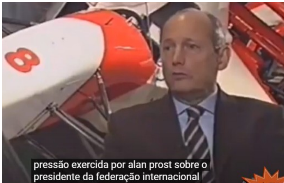
Imagem reproduzida do vídeo da entrevista de Ron Dennis sobre Prost no Japão 1989.

Anos mais tarde, Ron Dennis confirmou em entrevista em vídeo, que Prost pressionou Balestre para manipular o resultado do GP Japão 1989.